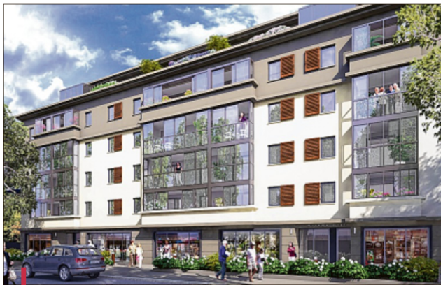
La résidence comptera 30 logements destinés à des seniors, 10 à des familles monoparentales. En rez d'immeuble, une microcrèche de 12 berceaux, une salle intergénérationnelle et l'ADMR.

"L'ADMR est associée au projet. Nos locaux seront installés au rez-de-chaussée et nous gérons la salle intergénérationnelle avec